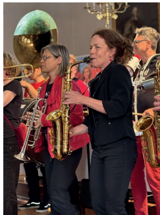
Musikalische Umrahmung der Mitgliederversammlung durch die Funky Marching Band der Musikschule Freiburg e.V.

Das Jahr 2025 war damit ein Jahr intensiver konzeptioneller Arbeit, strategischer Positionierung und politischer Vernetzung. Der Landesverband hat frühzeitig Verantwortung übernommen und die Interessen seiner Mitgliedsschulen mit Nachdruck vertreten. Mit den erarbeiteten Grundlagen, den aufgebauten Kooperationen und der klaren politischen Positionierung ist eine tragfähige Basis geschaffen, um die Einführung des Rechtsanspruches auf Ganztagsbetreuung für Kinder im Grundschulalter ab dem Schuljahr 2026/2027 aktiv mitzugestalten und die Rolle der öffentlichen Musikschulen als unverzichtbare Partner im Bildungswesen Baden-Württembergs nachhaltig zu stärken.