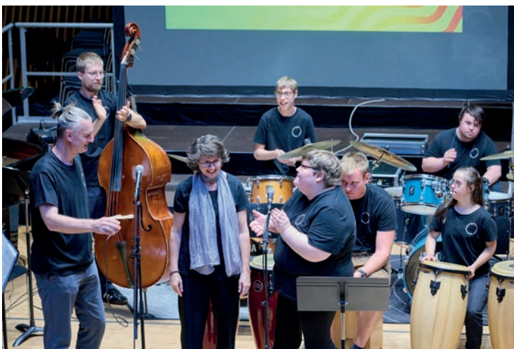
Ensemble „...grenzenlos“ der Musikschule Fellbach, Gewinner des Musikschulpreises 2025

Am 6. Mai 2025 hat die AG „Musikschule der Vielfalt“ erneut ein Online-Austauschforum für Lehr- und Leitungskräfte sowie für Inklusionsbeauftragte an Musikschulen zu inklusiven Themen angeboten. Der Themenschwerpunkt lag dieses Mal auf dem Thema „Für ein gesundes Miteinander: Selbstfürsorge und Teamkultur in der inklusiven Musikschularbeit“. Nach einem Impulsvortrag von Julia Faas zum Thema Selbstfürsorge hatten die 21 Teilnehmer*innen noch Gelegenheit für Fragen und Austausch.