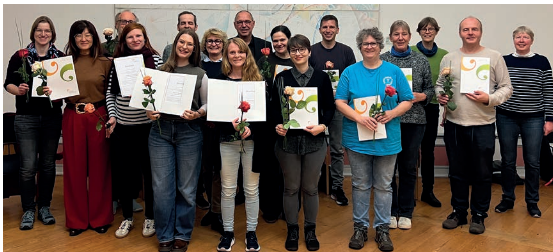
Absolvent*innen der Weiterbildung „Musikschule der Vielfalt“

Ein weiteres Online-Seminar für Musikschulleitungen in Kooperation mit der PH Ludwigsburg beschäftigte sich mit dem Recruiting in Musikschulen. Wie bei vielen anderen Kultur- und Bildungseinrichtungen sind qualifizierte Mitarbeitende die wichtigste Ressource für Musikschulen. Dem Personalmanagement und insbesondere bedarfsgerechten und professionellen Personalbeschaffungsprozessen kommt daher ein besonders hoher Stellenwert zu.