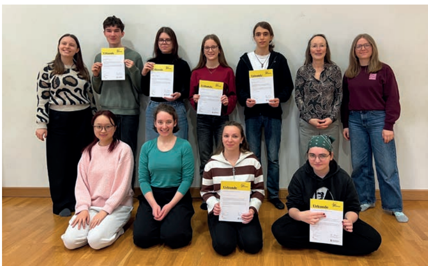
Absolvierende und Referierende des Schüler-Mentorenprogramms EMP / Rhythmik.

Das Schüler-Mentorenprogramm EMP/Rhythmik bietet die Chance, dass Jugendliche durch eigenes Erleben ein konkretes Bild von diesem Beruf erhalten und die Vielfalt, die Möglichkeiten und die Attraktivität musikpädagogischer Tätigkeit unmittelbar erfahren.