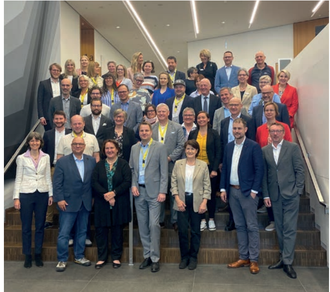
Rund 30 Akteurinnen und Akteure, die am Ganzttag in Baden-Württemberg mitwirken, haben sich auf ein gemeinsames Leitbild verständigt.

Die Landesvereinigung Kulturelle Jugendbildung (LKJ) Baden-Württemberg veranstaltete am 7. Mai 2025 im Hospitalhof in Stuttgart den Fachtag „Ganzttag: Kulturelle Bildung inklusive“ zur Umsetzung des Gesetzes auf ganztägige Förderung von Kindern im Grundschulalter (GaFöG) unter Einbeziehung der kulturellen Bildung in Baden-Würt-