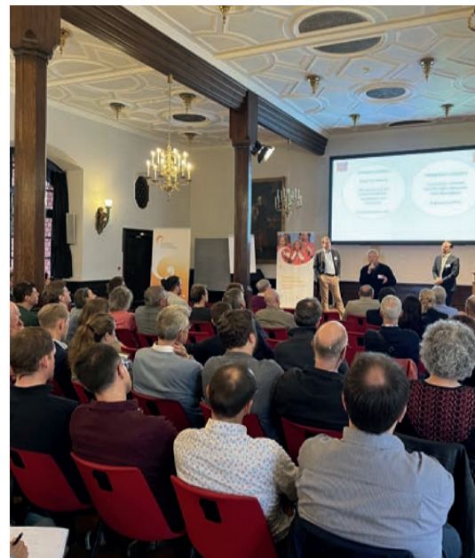
Jahrestagung in Freiburg