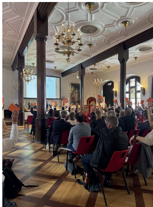
Mitgliederversammlung 2025 im Historischen Kaufhaus Freiburg.

Mitglieder der Delegiertenkonferenz sind die 16 Regionalsprecher*innen, die nun drei Ehrenvorsitzenden, zwei Vertreterinnen des Landesmusikschulbeirats Baden-Württemberg sowie Abgesandte von Städte-, Gemeinde- und Landkreistag.