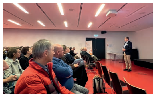
Herbsttagung in Stuttgart

qualifikation als Chance verstanden wird – für die persönliche Entwicklung jeder einzelnen Lehrkraft, aber auch für die Sicherung der Qualität der musikalischen Bildung an den Musikschulen im Land?